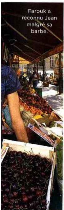
Farouk a reconnu Jean malgré sa barbe.

Croisé à Port-Leucate, Frédéric Beigbeder , très en forme, venu présenter Un roman français , son nouveau livre, pendant la manifestation Les auteurs à la plage. Remarqué à la terrasse d'un café rue Roquepine, Alain Chabat profitant du soleil. Vu devant le cinéma Pathé-Wepier à Paris, Fabrice Luchini arborant une barbe poivre et sel. Aperçue au Cap Ferret, toute l'équipe de Camping 2 , Franck Dubosc , Emmanuelle Seigner et Fabien Onteniente en train de dîner à L'escale. Reconnu, le journaliste-aventurier Antoine de Maximy se promenant en chemise sur l'île d'Aix en Charente-Maritime. Vu, le ténor Roberto Alagna en train de buller en terrasse de L'avenue à Paris.