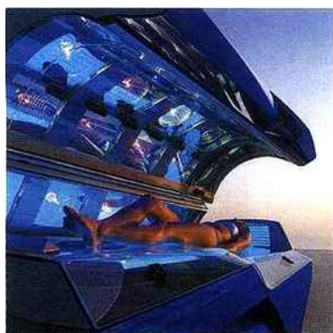
Le bronzage est l'une des principales raisons du passage des femmes dans les Centres Point Soleil.