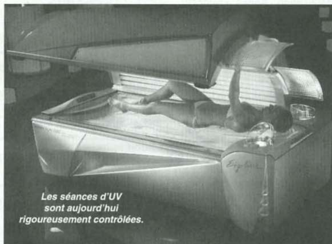
Les séances d'UV sont aujourd'hui rigoureusement contrôlées.

Basé rue Honoré Picon, c'est-à-dire dans un lieu de passage entre la place Stalingrad et le cinéma Mégarama, il mise dans un premier temps sur 40 clients par jour dans un secteur où les bâtiments tertiaires fleurissent à vue d'œil. L'avenir est-il sous le soleil ou sous les UV exactement ?